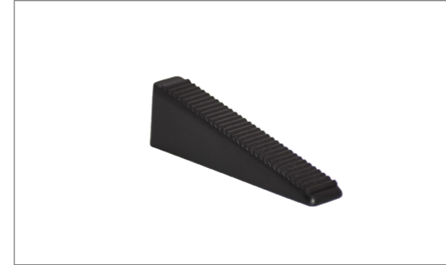
Bolsas de cuñas 100 uds. Wedge-Base set 100 units.