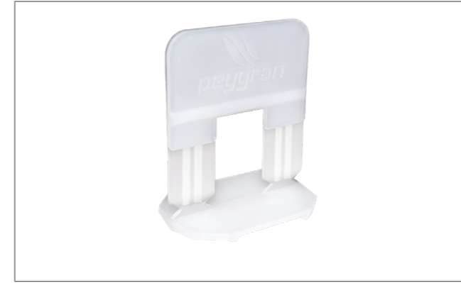
Bolsas de calzos 1 mm, 2mm y 3mm., 100 uds. Crosshead Set 1Mm, 2Mm And 3mm., 100Units