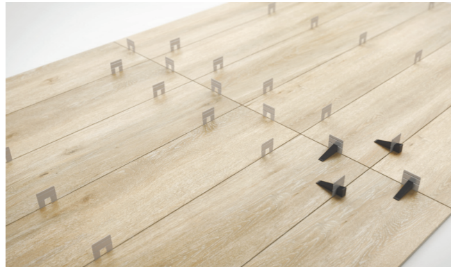
Sistema que mejora y facilita la colocación de cerámica. System that improves the installation of tiles.