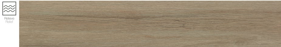
Tevere Cedro 20 x 114 cm. P2014L