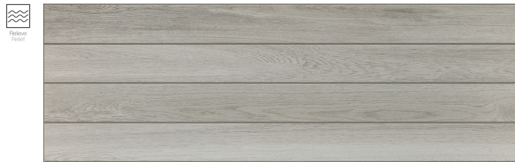
Stripe Tevere Ceniza 30 x 90 cm. WB3090L

Pavimento coordinado Coordinated floor tiles