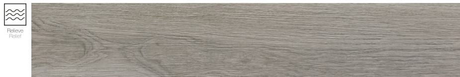
Tevere Ceniza 20 x 114 cm. P2014L