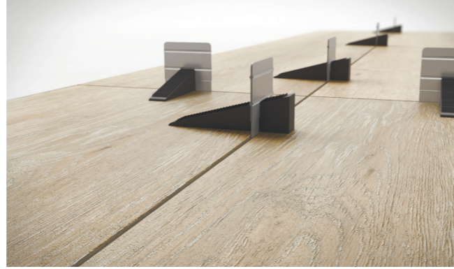
Consigue la nivelación de piezas deseada con un perfecto acabado. Get an excellent levelling of pieces with a perfect finishing.