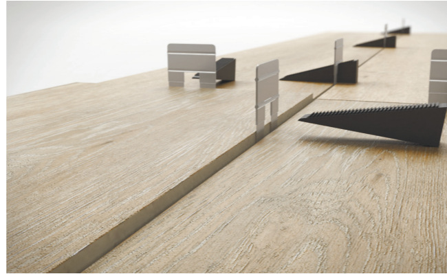
Fácil fijación y extracción de la prótesis. Easy fixing and levelling of prothesis.