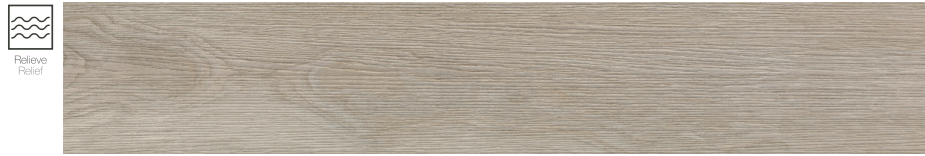
Tevere Natural 20 x 114 cm. P2014L