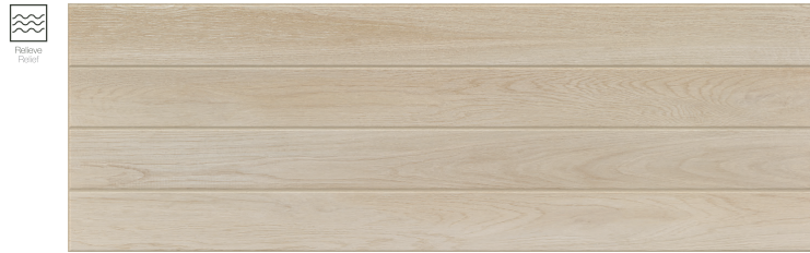
Stripe Tevere Natural 30 x 90 cm. WB3090L