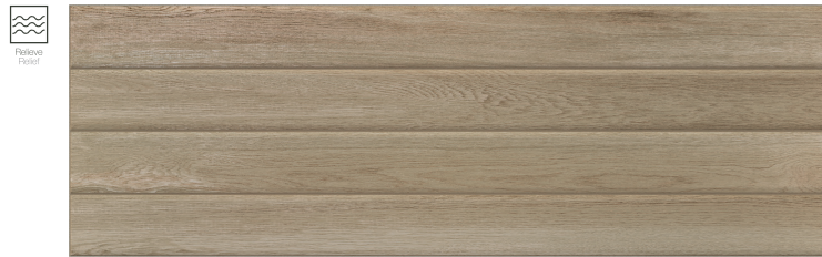
Stripe Tevere Cedro 30 x 90 cm. WB3090L