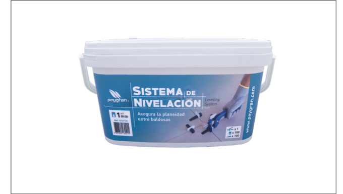
Kit: 100 calzos ( 1 mm.) + 100 cuñas + tenaza Kit 100 Each