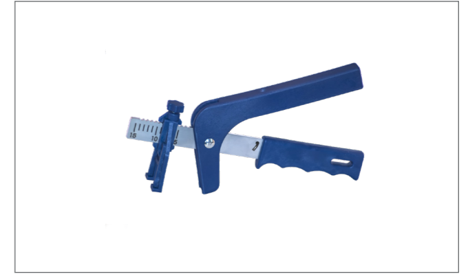
Alicate para cerámica 1 ud. Plier With Graduated Scale